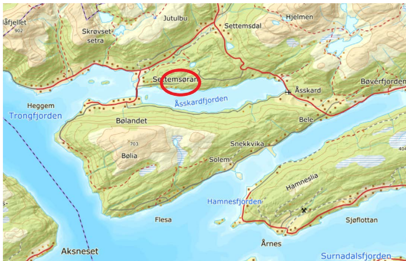
Kartet viser beliggenheten for planområdet

Formålet med planarbeidet er foretting og oppdatering av gjeldene reguleringsplan samt tilrettelegging for båthavn. For nærmere redegjørelse, se vedlegg fra oppstartsmøte med kommunen.